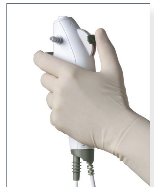
Das ergonomische und leichte Handstück bietet optimalen Halt und Griffkomfort