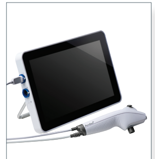
Ambu aScope 4 Broncho Slim und Ambu aView 2 Advance