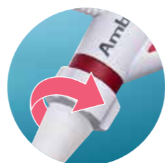
120°-Rotation nach links/rechts

BRINGEN SIE DIE VORTEILE DER EINWEG-TECHNOLOGIE IN DIE PNEUMOLOGIE