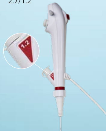
Ambu® aScope™ 5 Broncho 2.7/1.2