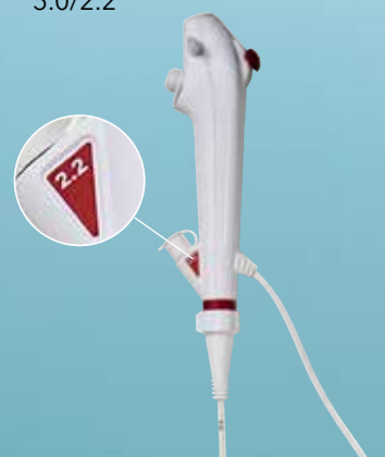
Ambu® aScope™ 5 Broncho HD 5.0/2.2