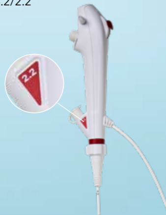
Ambu® aScope™ 5 Broncho 4.2/2.2