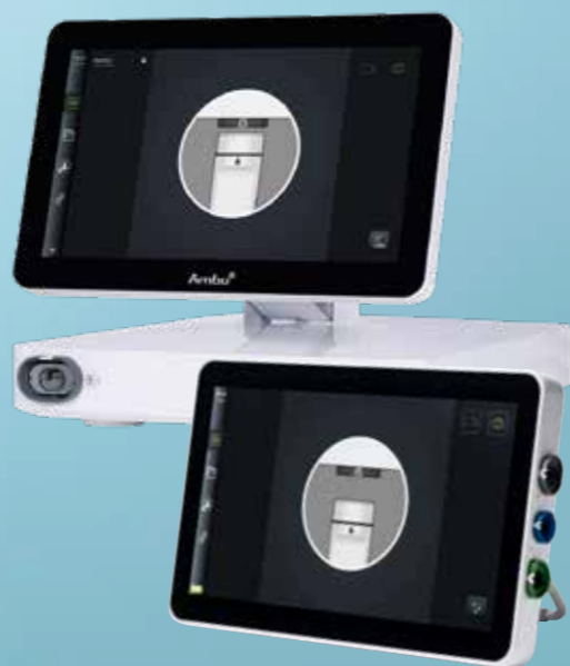
Ambu® aView™ 2 Advance Visualisierungseinheit und Ambu® aBox™ 2 Visualisierungs- und Prozessoreinheit