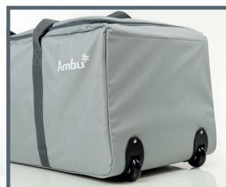
AmbuMan Basic 4er Set 2 x Tragetasche mit Rollen (für je zwei AmbuMan Basic)

Ambu GmbH In der Hub 5 61231 Bad Nauheim Tel. 06032 9250-0 Fax 06032 9250-200 www.ambu.de