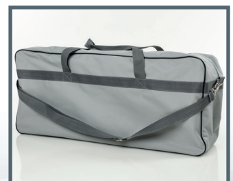
Tragetasche AmbuMan Basic