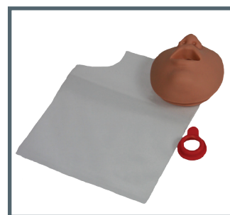
Ambu Hygienesystem für Ambu Junior