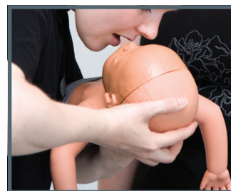
Mund-zu-Mund Beatmung Ambu Baby

Nach Beendigung der Ventilation strömt die Luft in den Kopf zurück und der Einweg-Luftbeutel zieht sich zusammen. Die eingeblassene Luft wird durch Mund und Nase wieder ausgestoßen.