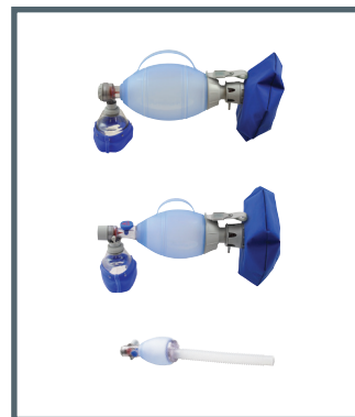
Ambu Transparente Silikon-Gesichtsmaske und Ambu Oval Plus Silikon-Beatmungsbeutel

Ambu A/S Baltorpbakken 13 DK - 2750 Ballerup Denmark Tel. +45 7225 2000 Fax +45 7225 2053 www.ambu.com